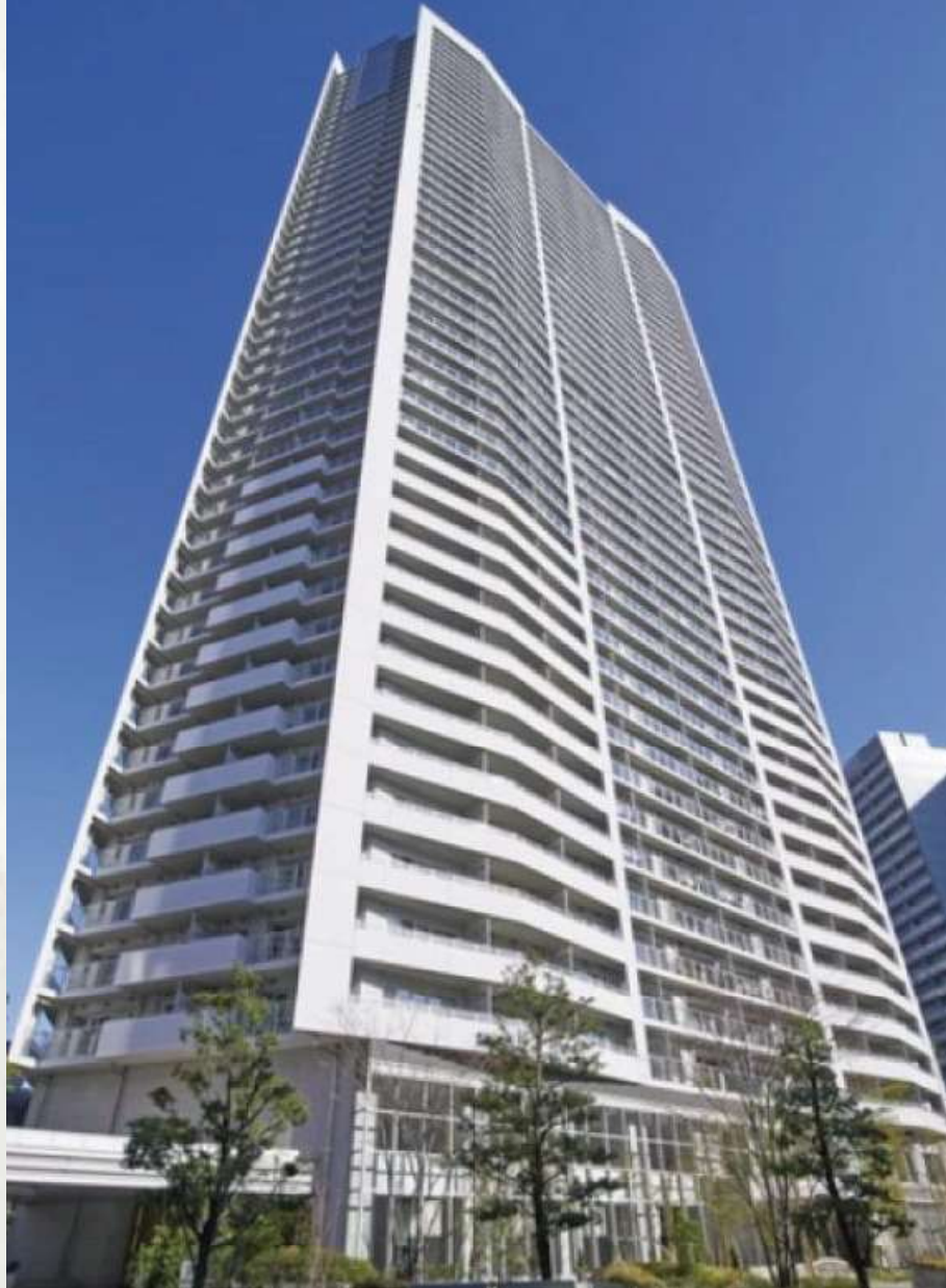
キャピタルマークタワー