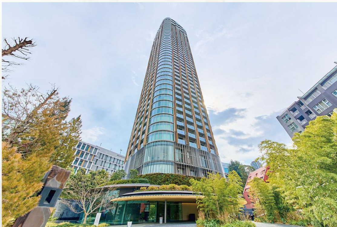
パークコート赤坂檜町ザタワー