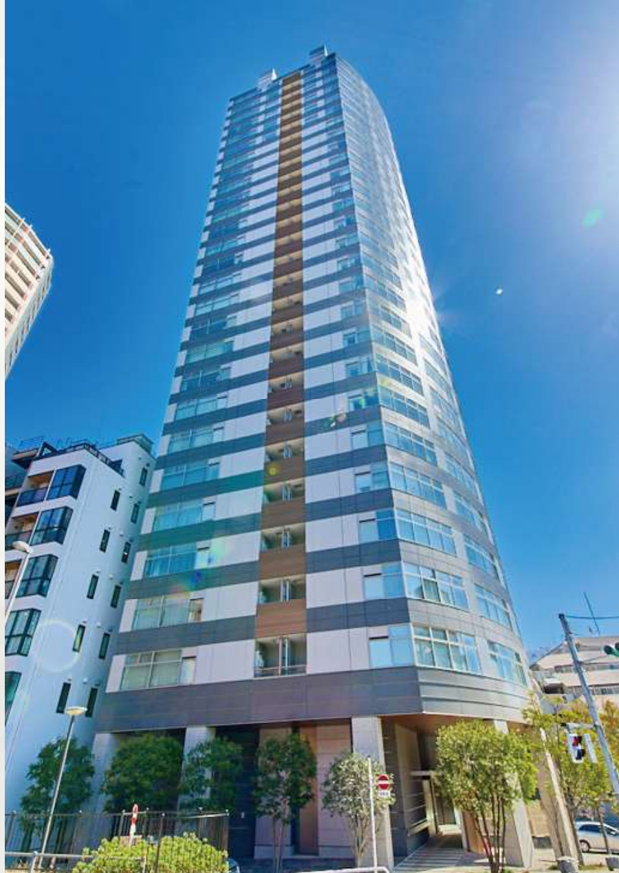
マジェスタワー六本木