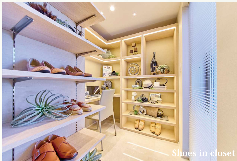
Shoes in closet