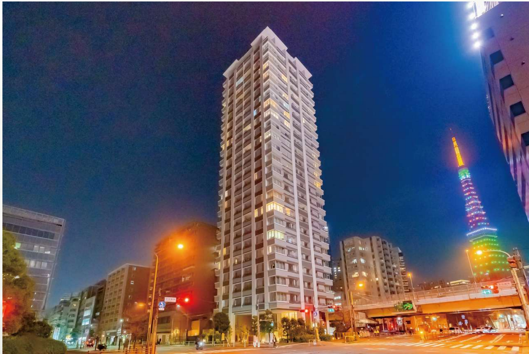
サンウッド三田パークサイドタワー