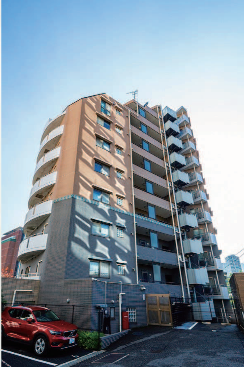
エクセル原宿グレイスコート