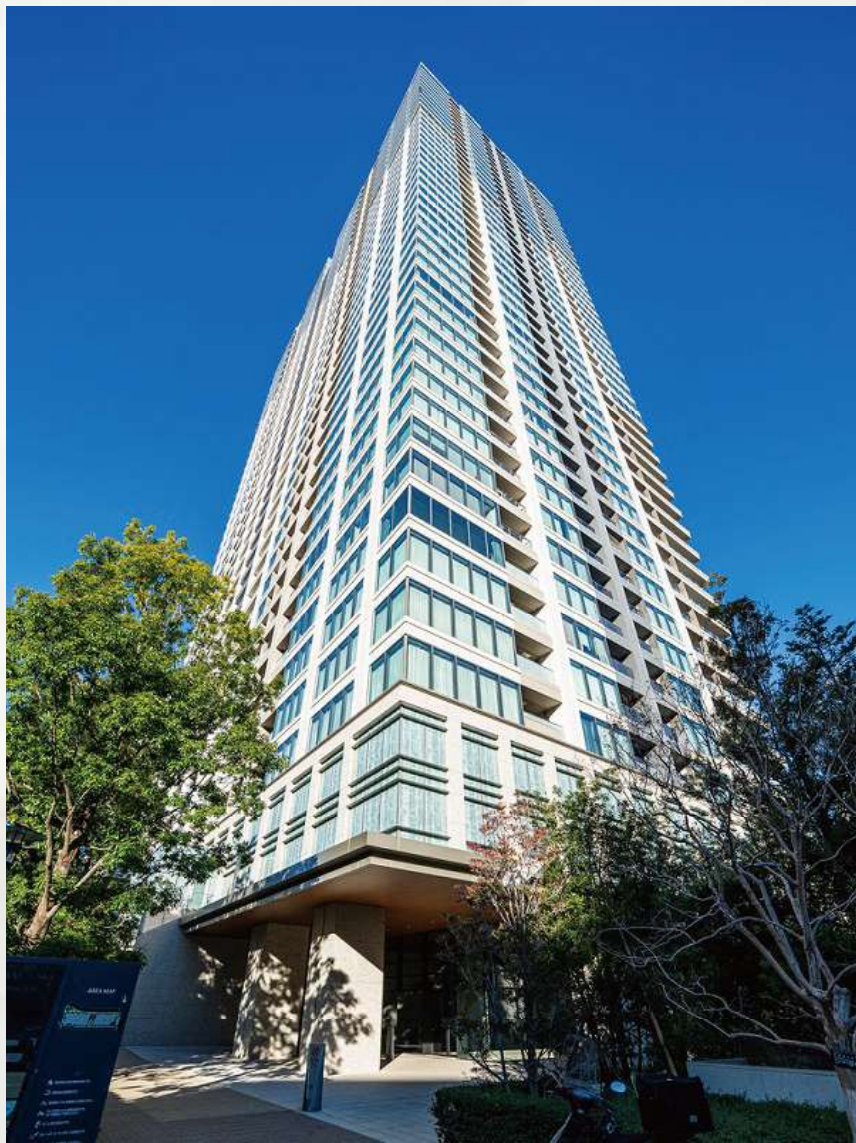
白金ザ・スカイ E棟 (高層階 北東角住戸)