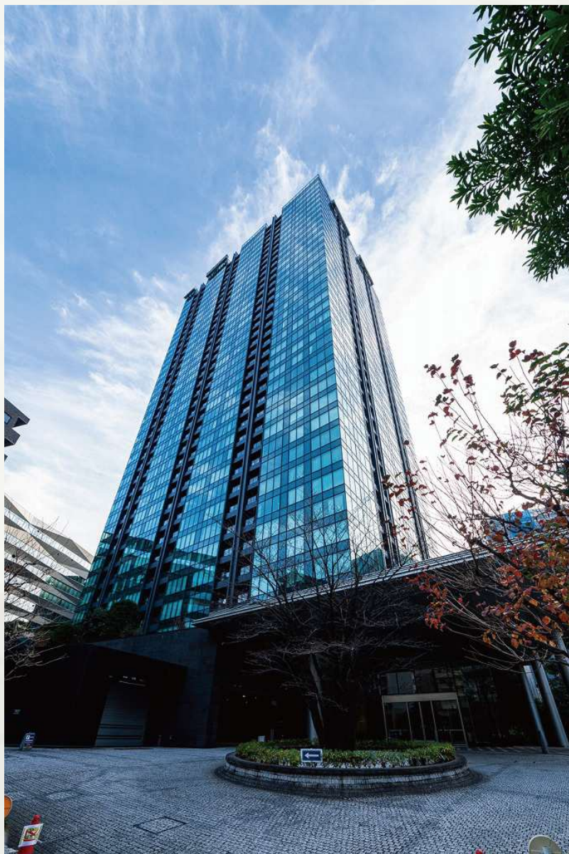
シティタワー麻布十番