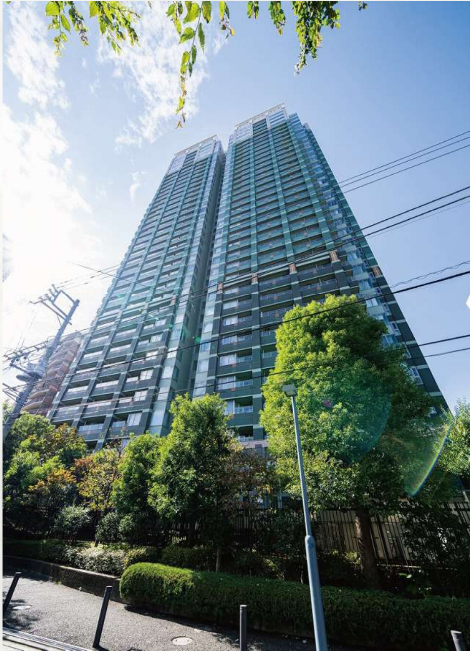
シティタワー高輪