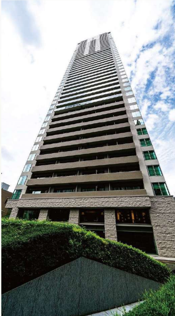
赤坂タワーレジデンス トップオブザヒル