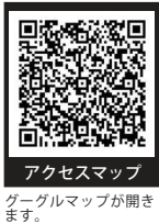
アクセスマップ Googleマップが開きます。