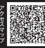
アクセスマップ グーグルマップが 開きます。